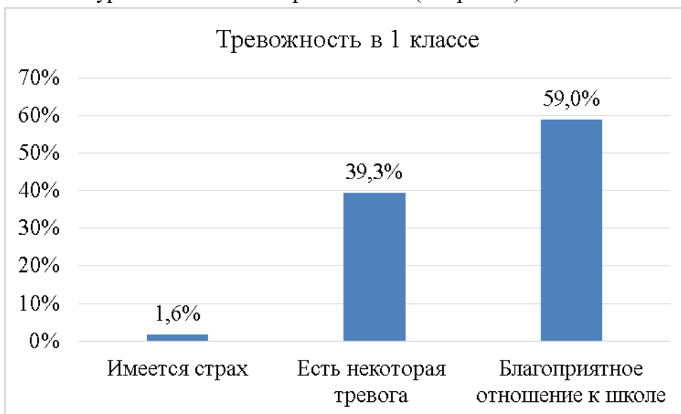
Рис. 3. Показатели уровня школьной тревожности 1 классов в 2021 году

Переход на новый уровень образования, а в первом классе на новый этап жизни, связанный с переходом в другую образовательную организацию (детский сад – школа), находит отражение в уровне тревожности обучающихся: 1,6% первоклассников имеют страх, связанный с обучением в школе, 39,3% имеют некоторую тревогу, связанную с обучением в школе, как новой жизненной ситуацией (см. рис.3), и 9,1% пятиклассников имеют высокий уровень школьной тревожности (см. рис. 4).